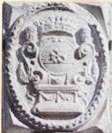
Blason des Raby (La Balme)